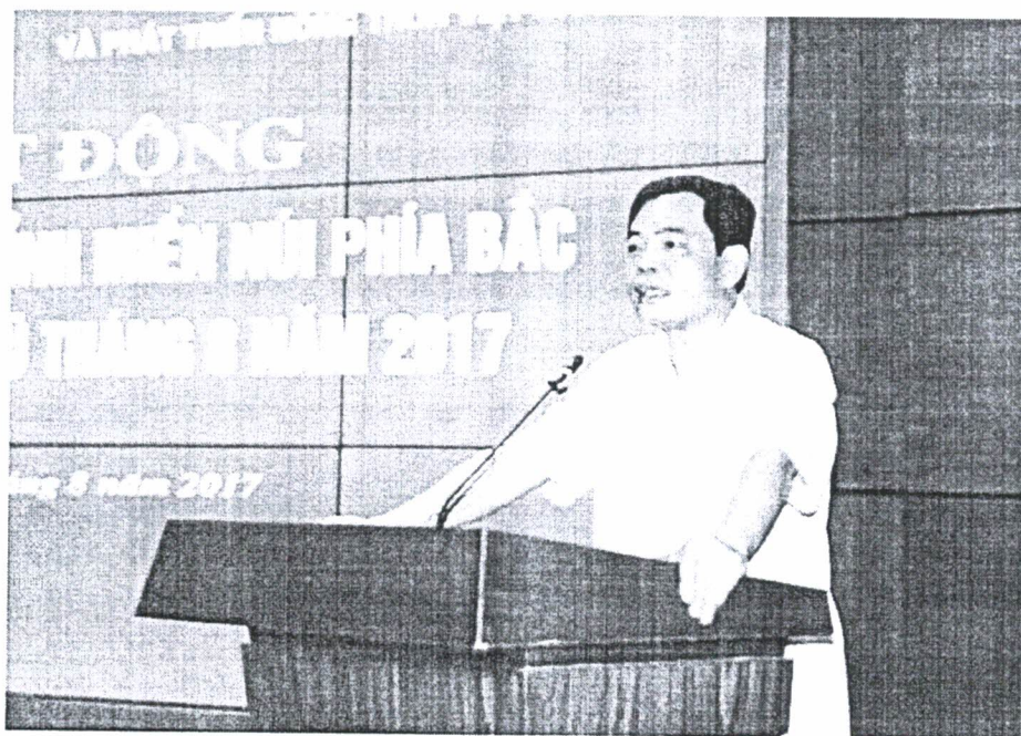
Bộ trưởng Bộ NNPTNT Nguyễn Xuân Cường phát động quyên góp ủng hộ người dân bị thiệt hại do bão lũ

Bộ trưởng Bộ Nông nghiệp và PTNT Nguyễn Xuân Cường khẳng định, trận lũ quét xảy ra đêm ngày 2/8 và ngày 3/8 vừa qua gây ra hậu quả hết sức khốc liệt ở các tỉnh miền núi phía Bắc, theo người dân huyện Mù Cang Chải (Yên Bái), trận lũ trên suối Nậm Kim là lịch sử 40 năm ở đây. Theo người dân huyện Mường La (Sơn La) trận lũ ồng trên suối Nậm Păm là kỷ lục 70 năm. Theo Bộ trưởng Nguyễn Xuân Cường, dòng suối Nậm Păm trước đây có dòng chảy rõ ràng, nhưng sau trận lũ ồng đã trở thành một bãi đá dày 2 đến 3m, điều đó cảnh báo về mức độ của thiên tai ngày càng khủng khiếp. Bộ trưởng cũng cho rằng thiên tai đang có dấu hiệu bất thường vì từ đầu tháng 6/2017 đến ngày 17/7/2017, tức là gần 1 tháng rưỡi, tại miền núi phía Bắc có mưa liên tục. Hiện tượng này cũng tương tự như các đợt mưa kéo dài cả tháng ở Nam Trung bộ hồi tháng 10 năm ngoái, sau đó gây trận lũ lụt kinh hoàng.