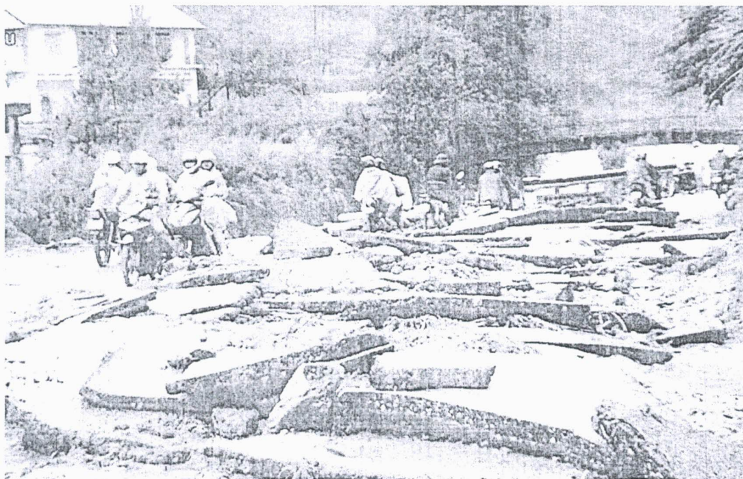
Mưa lũ tàn phá giao thông khu vực Tây Bắc. Số người thương vong liên tục gia tăng.